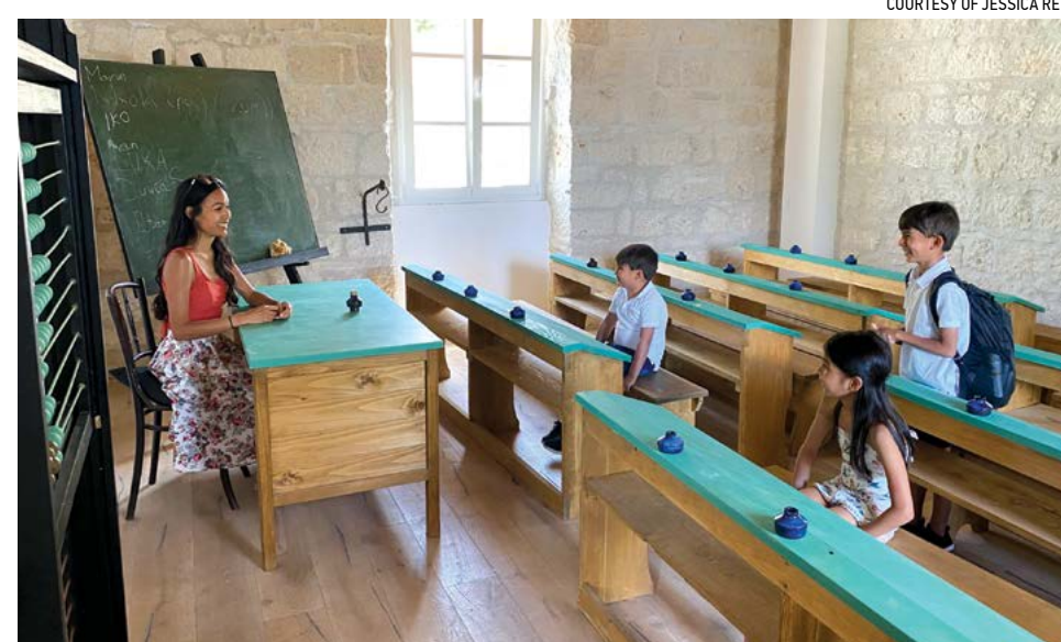
▲ Cô Rey dạy các con học tại gia.