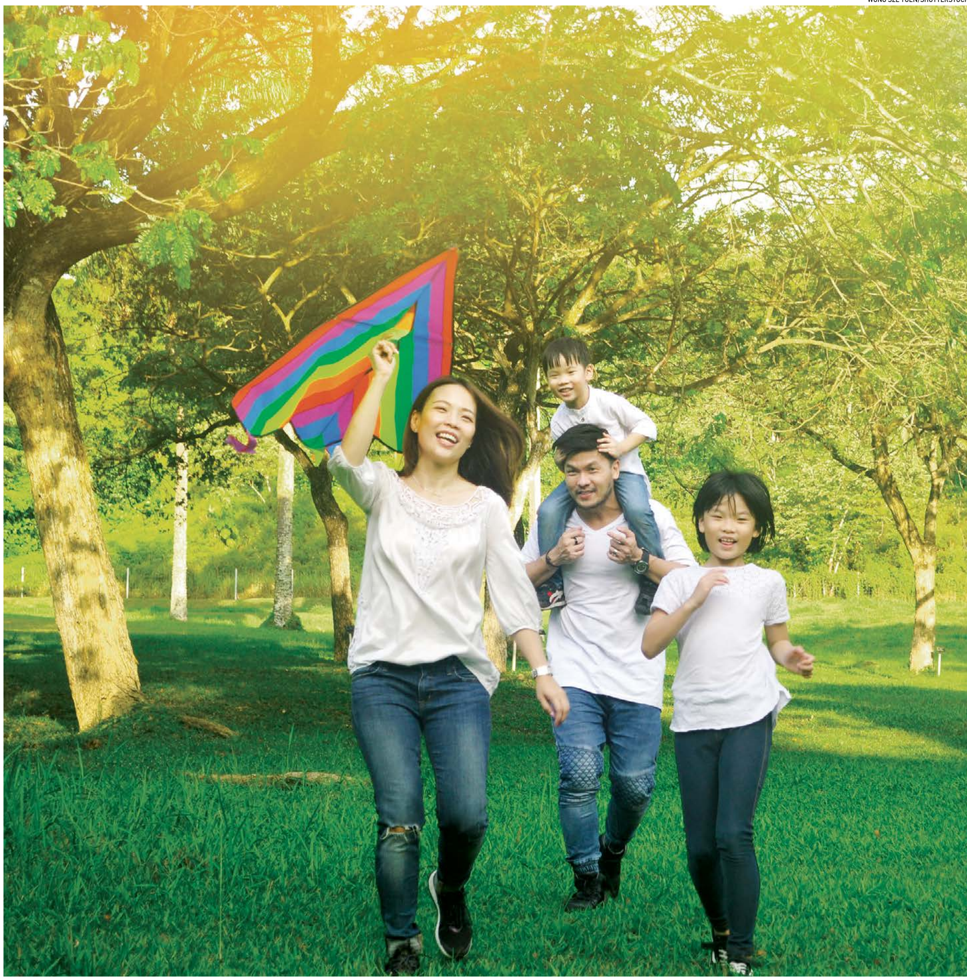
▲ Tự do là một trong những giá trị tuyệt vời nhất của mùa hè.