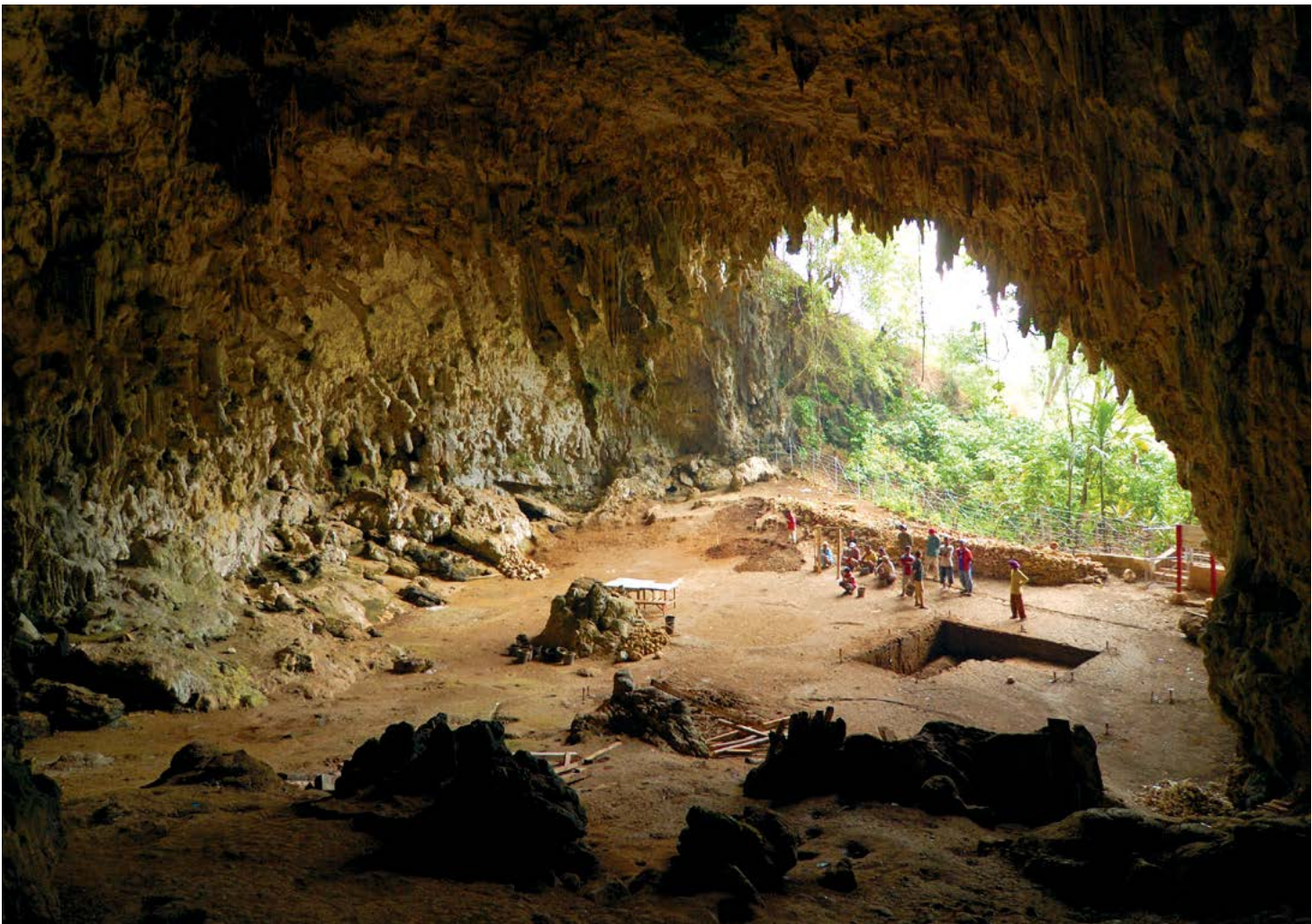
▲ Quang cảnh bên trong hang Liang Bua hay còn gọi là hang hobbit trên đảo Flores, Indonesia, nơi phát hiện di chỉ của người homo floresiensis.

Chúng người Homo floresiensis có bộ não nhỏ và chiếc cằm không rõ ràng. Mặc dù gần đây không ai nhìn thấy họ, nhưng không thể khẳng định