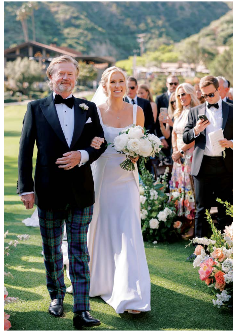
▲ Cô Fumia bước ra.