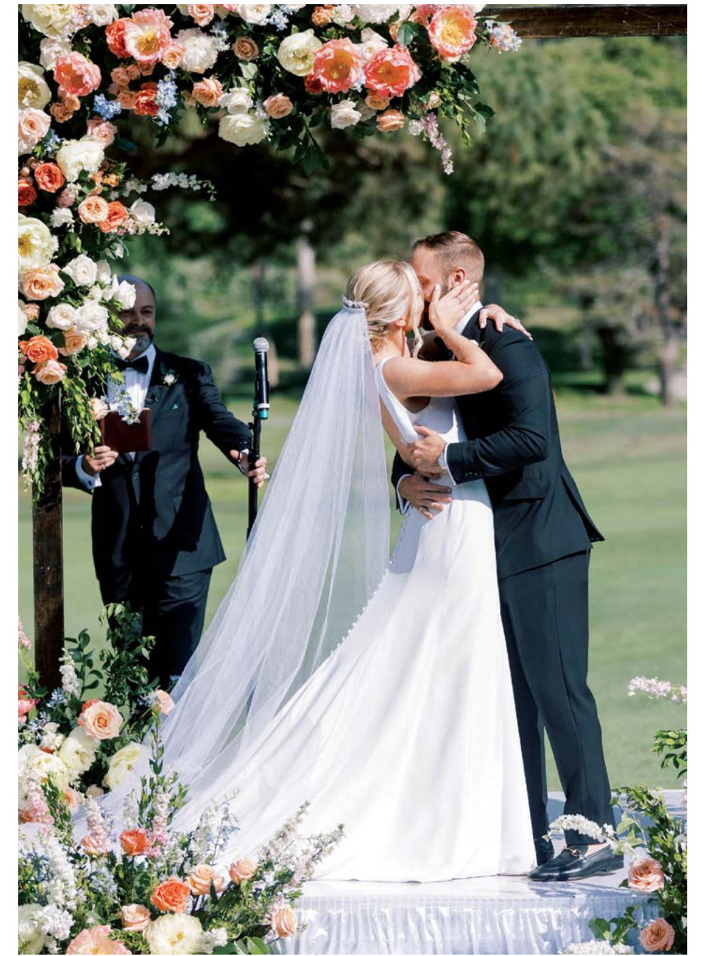
▲ Vợ chồng cô Fumia tại lễ cưới.