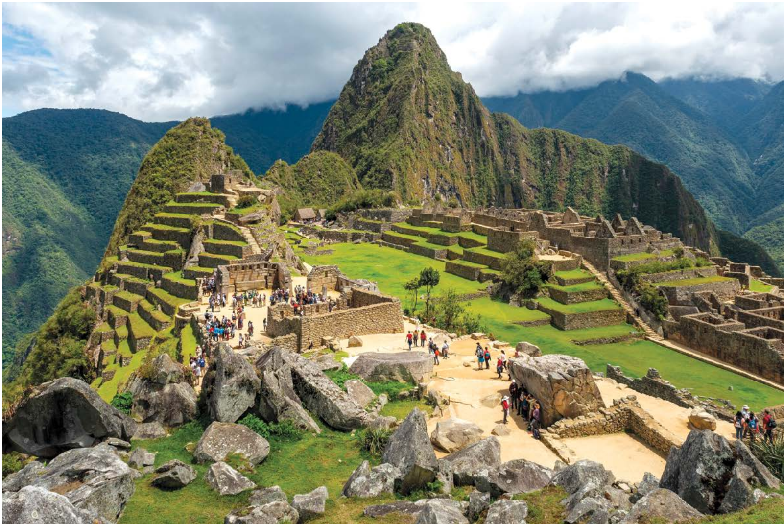
▲ Du khách đi trên các con đường của tàn tích Machu Picchu ở Peru.