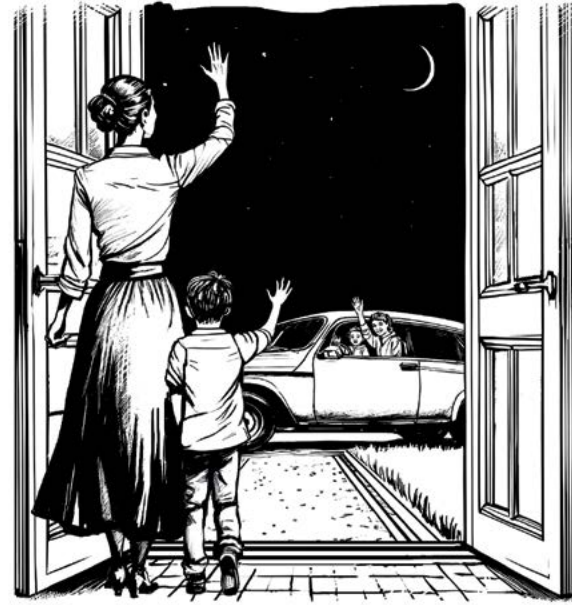
▲ Cựu nhân viên mật vụ Evy Poumpouras có một quy tắc cứng rắn là không cho con qua đêm ở nhà người khác. Nhưng nếu bạn đang cân nhắc để con mình ngủ lại nhà ai đó, thì hãy chắc chắn rằng bạn thực sự biết rõ những người mà chúng sẽ ở cùng.

Đây là tình huống mà việc phát triển trực giác của bạn và của con bạn trở nên quan trọng, cũng như việc khích lệ giao tiếp cởi mở với con. Nhưng cô Poumpouras nói thêm rằng “bạn không nên cho rằng con bạn sẽ kể với bạn nếu có chuyện gì đó xảy ra” – chúng có thể thấy sợ hãi hoặc xấu hổ, đặc biệt là nếu chúng quen biết người đó và không muốn gây rắc rối cho cha mẹ.