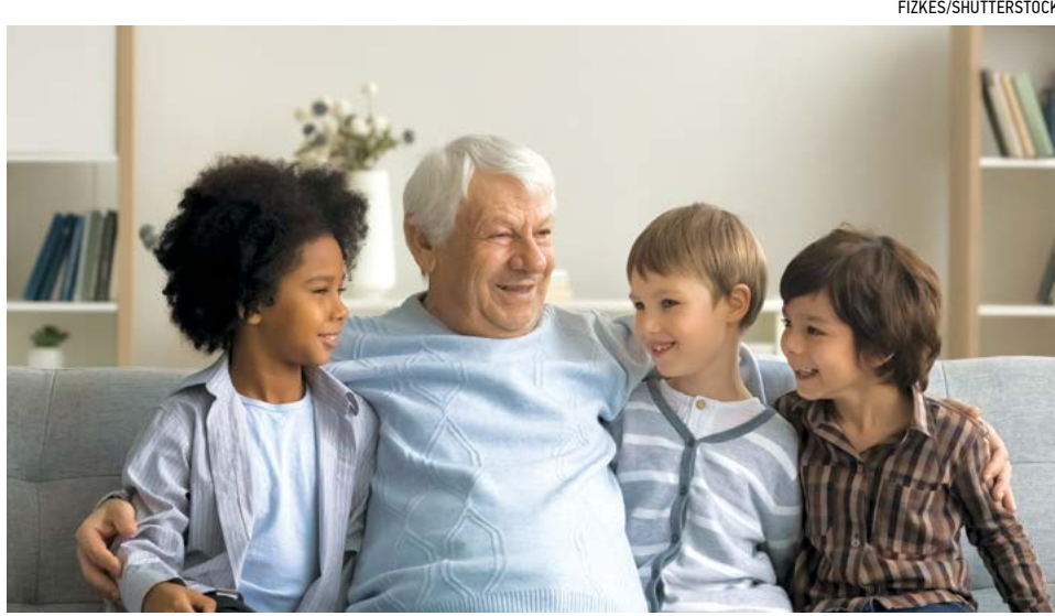
▲ Hãy chia sẻ quá khứ của bạn với con cháu, và bạn hữu để giúp họ kết nối với quá khứ và từ đó đưa một phần câu chuyện của bạn vào tương lai của họ.

linh tinh, từng chia sẻ với tôi rằng: “Tôi luôn nghĩ đến việc vứt bỏ đồng rác này, nhưng có lẽ tôi sẽ để lại công việc đó cho các con mình.” Không, không, không. Hãy sắp xếp mọi việc ổn thỏa, tất cả mọi thứ, từ đi chích cho đến nhận học bổng và hộp đồ trong nhà xe. Bạn có thực sự muốn con cháu của mình gánh vác trách nhiệm đó không?