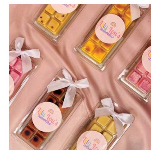
▲ Các mẫu thủ của nhân hàng Lily Lou's Aromas.