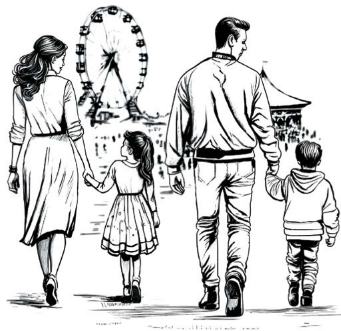
▲ Khi đi ra nơi đông người, hãy luôn quan sát các con.

Hãy chắc chắn rằng các con nhớ số điện thoại của bạn và thuộc nằm lòng địa chỉ nhà để các con luôn có thể liên lạc với bạn.