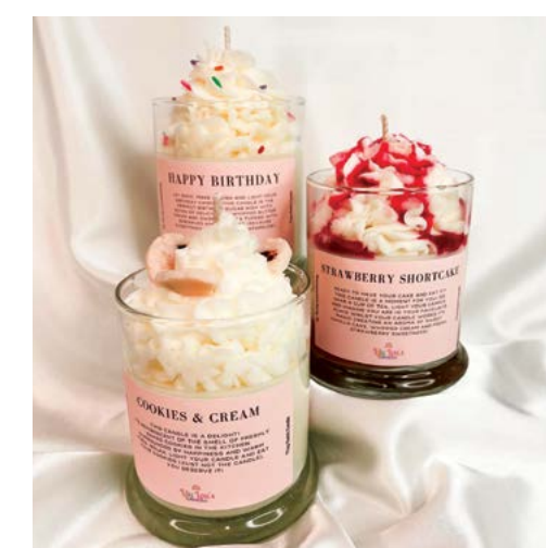
▲ Một vài “nến hình bông kem” của Lily.