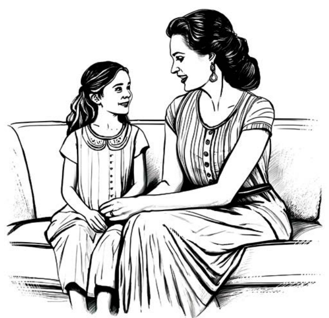
▲ Rèn luyện cho con tin vào trực giác của bản thân.

Dựa trên kinh nghiệm là một thẩm vấn viên tại đơn vị điều tra tình nghi của Cơ quan Mật vụ, cô Poumpouras giải thích rằng cách tiếp cận hiệu quả là hỏi con bạn những câu hỏi nghe có vẻ không giống như câu hỏi. Những câu hỏi ẩn này kiểu như là để nghi các con kể cho bạn nghe về một ngày của chúng hoặc người giáo viên mà con thường hay phàn nàn. Bằng cách lắng nghe, bạn có thể hiểu rõ hơn chuyện gì đang xảy ra. “Hãy tỏ mò,” cô nói. “Hãy là những bậc cha mẹ hiểu kỳ.”