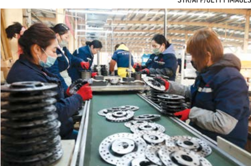
▲ Công nhân làm việc trên các sản phẩm nhôm tại một nhà máy ở Hoài Bắc, tỉnh An Huy, miền đông Trung Quốc, ngày 30/01/2023.

Thuế tăng có thể làm tăng giá cho các nhà sản xuất và người tiêu dùng trong nước, nhưng thuế cũng sẽ làm tăng doanh thu cho chính phủ Hoa Kỳ, yếu tố có thể giúp giảm thuế thu nhập của Hoa Kỳ hoặc giúp trả bớt nợ quốc gia. Thuế sẽ giúp các ngành công nghiệp thép và nhôm của Hoa Kỳ duy trì hoạt động trong các nhà máy, tăng việc làm, và xây dựng hệ sinh thái công nghiệp của Hoa Kỳ. Điều đó là rất quan trọng vì trong các trường hợp khẩn cấp Hoa Kỳ có thể dựa nhiều hơn vào những gì chúng ta có thể sản xuất trong nước, chứ không phải những gì có thể bị chôn vùi trong quá trình vận chuyển từ Trung Quốc hoặc bị từ chối không cho bán ra thị trường Hoa Kỳ. Ví dụ, nếu Hoa Kỳ và Trung Quốc xảy ra chiến tranh vì Đài Loan, thì liệu Trung Cộng có cho phép thép Trung Quốc được vận chuyển đến Hoa Kỳ không? Đừng đặt cược mạng sống của