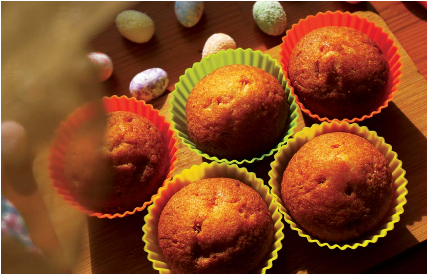
▲ Khuôn nướng bánh bằng silicone đem lại sự dễ dàng và tiện lợi cho chủ bếp. Tuy nhiên, có vài điều cần lưu ý để tối ưu hóa tính an toàn khi sử dụng.