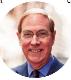
Chuyên gia cố vấn hôn nhân Gary Chapman.

mình vào mỗi tối thứ Tư và muốn tiếp tục việc đó, nhưng nửa kia lại muốn có ấy làm một việc đặc biệt quan trọng đối với mình vào những tối đó; vậy thì họ sẽ thương lượng với nhau như thế nào?” Ông Chapman cho hay. “Khi còn độc thân, bạn lấp đầy ngày của mình bằng những hoạt động riêng. Nhưng khi bạn kết hôn, mọi thứ sẽ thay đổi. Bạn sẽ gặp khó khăn trong việc duy trì cảm giác gắn kết nếu bỏ qua những điều này.”