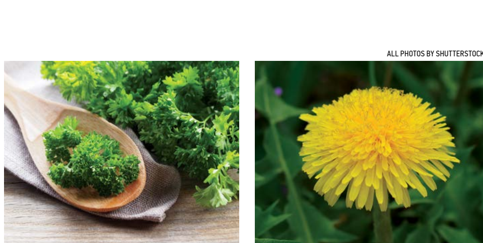
▲ Ngò tây chứa đầy đủ các vitamin, giúp ngăn ngừa nhiễm trùng hệ thống đường tiểu.

nguồn vitamin C dồi dào nhất. Lá, hạt và rễ của ngò tây có đặc tính lợi tiểu, giúp đẩy các vi sinh vật ra khỏi bàng quang và đường tiểu.