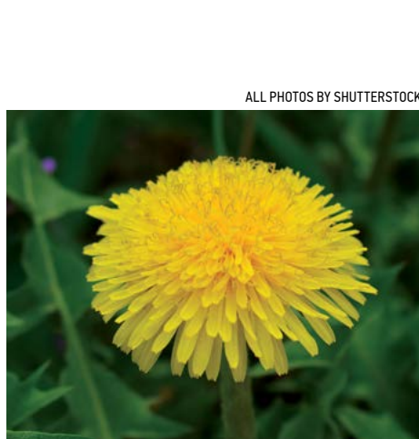
▲ Bồ công anh có nhiều lợi ích y học, như chống oxy hóa, bảo vệ gan và chống ung thư.

thích và điều hòa kinh nguyệt. Lá, thân, rễ và hạt của ngò tây đều được sử dụng làm thuốc.