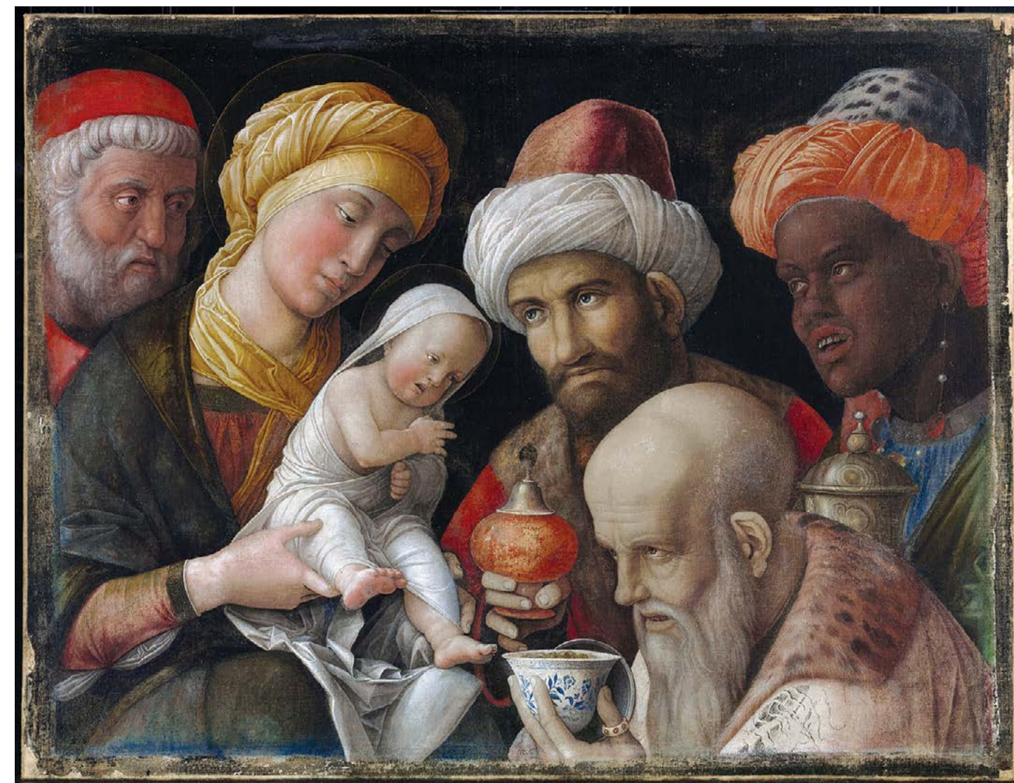
▲ Tác phẩm "Adoration of the Magi" (Sự tôn thờ của các nhà thông thái) của họa sĩ Andrea Mantegna, vẽ khoảng năm 1495-1505. Tranh sơn distemper trên vải lanh. Tranh trưng bày thuộc Viện Bảo tàng J. Paul Getty, California.

Danh họa Mantegna là một bậc thầy trong việc truyền tải cảm xúc, nhưng ông cũng đã không tiếc công sức để khắc họa trang phục và đồ vật. Để mắt đến từng chi tiết, ông khoắc lên Chúa Hài Đồng chiếc áo toga La Mã khác thường, và ba nhà thông thái mặc áo khoắc lông thú, đồ trang sức, và chiếc khăn vấn đầu xa hoa. Thậm chí hai chiếc bình họ mang theo còn phong phú hơn nữa: một chiếc bình phát sáng chói lọi và chiếc còn lại có những vòng xoáy gợn sóng. Hai chiếc bình có nắp