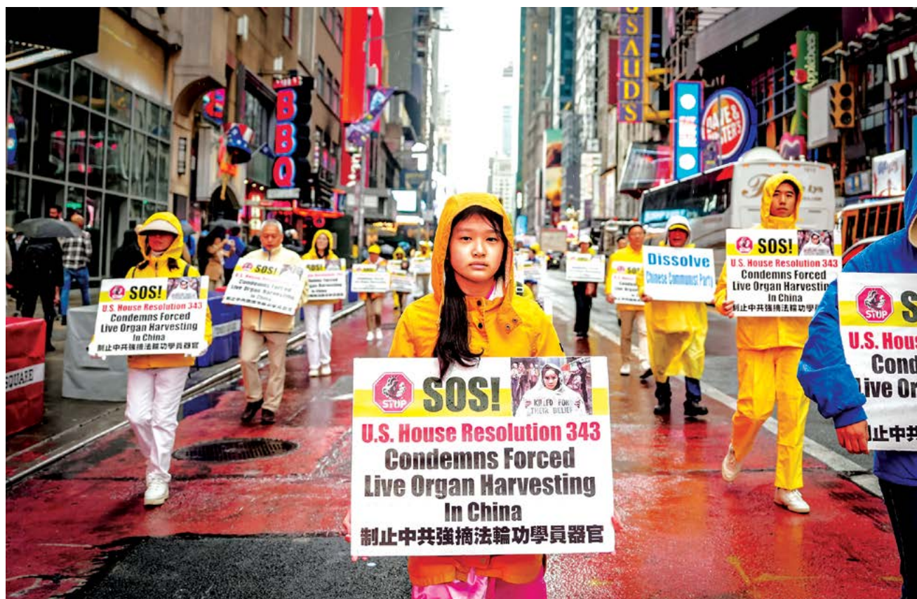
▲ Các học viên Pháp Luân Công tham gia cuộc diễu hành kỷ niệm Ngày Pháp Luân Đại Pháp Thế Giới, đồng thời kêu gọi chấm dứt cuộc bức hại Pháp Luân Công ở Trung Quốc, tại thành phố New York, hôm 10/05/2024.