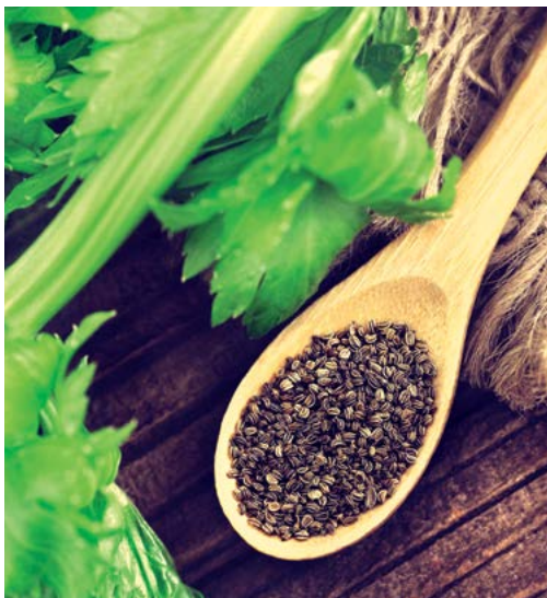
▲ Hạt, thân và tinh dầu cắn tây được sử dụng làm thuốc.