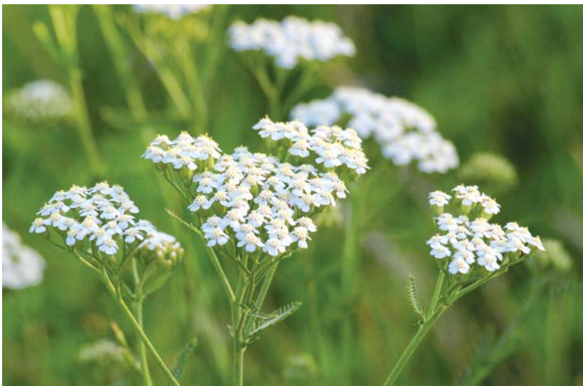
▲ Cô thi giúp làm se, gây đổ mồ hôi, lợi tiểu, chống viêm, kháng khuẩn, giảm sốt và cảm máu.