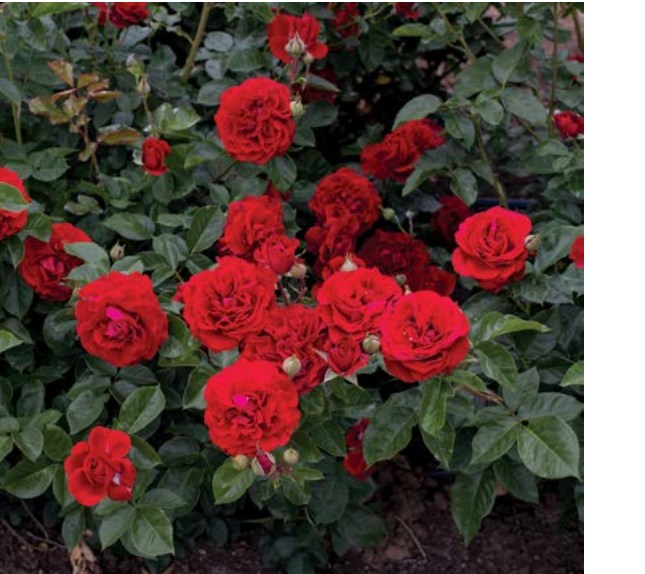
(Từ trái sang phải) Hoa hồng Louise Clemens, Matchless Mother, và Braveheart.