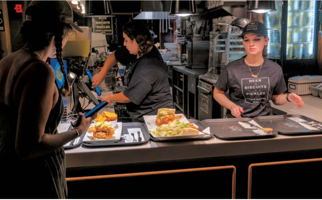
▲ Nhân viên làm việc tại một khu bán thức ăn ở thành phố New York, hôm 11/07/2024.

thực vẫn đang lan rộng và dai dẳng như vậy, lượng người Mỹ làm thêm một công việc thứ hai có thể sẽ tăng lên nhiều. Lạm phát thực đối với các nhu cầu cơ bản không hề được kiểm soát hoặc nhẹ nhàng như một số người muốn chúng ta tin. Giá xăng đã tăng gấp đôi kể từ năm 2021. Giá thực phẩm cơ bản cũng cao hơn nhiều. Từ năm 2021 đến năm 2024, trứng đã tăng hơn 50%, tăng gấp đôi so với tỷ lệ lạm phát chính thức 25% của các thực phẩm trong cùng thời kỳ. Trong khi đó, giá nhà đã tăng 54% kể từ năm 2019.