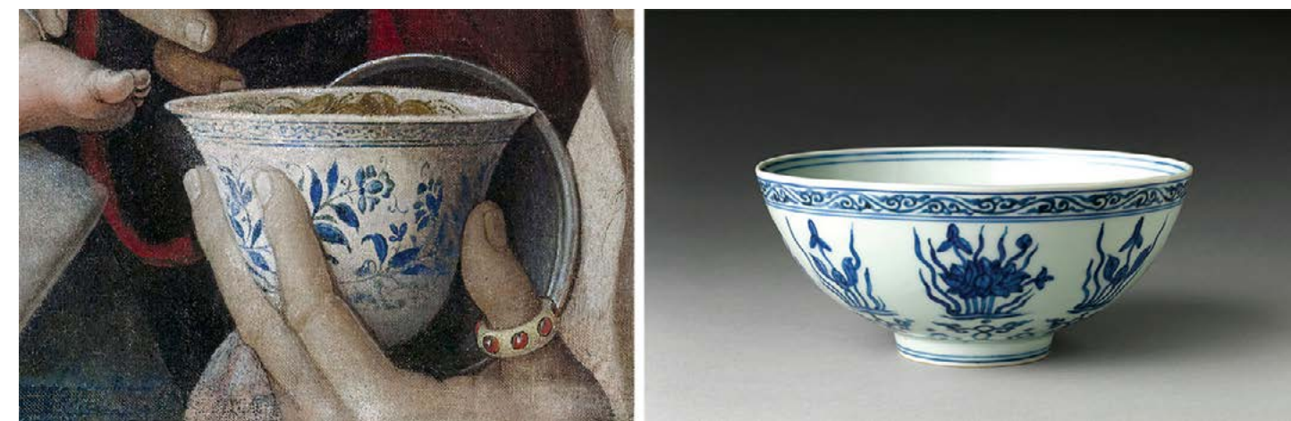
▲ Bên trái là chi tiết món đồ gốm Trung Hoa từ tác phẩm "Adoration of the Magi" (Sự tôn thờ của các nhà thông thái) của họa sĩ Mantegna, và bên cạnh là hiện vật "Chen Hua Sen", tạo tác khoảng đầu thế kỷ 16. Gốm sứ được sơn màu xanh lam trang men trong. Viện bảo tàng Nghệ thuật Metropolitan, thành phố New York.

đây phía sau dường như được làm bằng đá quý, trong khi chiếc cốc hồ miệng phía trước có vẻ trung thành với kiểu đồ gốm trắng men xanh và trắng của Trung Hoa - loại gốm sứ điển hình triều đại nhà Minh đương thời (1368-1644). Họa sĩ Mantegna đã rất thận trọng khi vẽ đường viền hoa cỏ xung quanh mép cốc bằng sắc xanh đậm. Nhưng bằng cách nào mà đồ gốm sứ Trung Hoa lại đến được Ý vào thời kỳ Phục Hưng? Những họa sĩ như ông Mantegna đã nhìn nhận đồ vật này như thế nào, và tại sao ông lại chọn khắc họa chúng trong tay của một nhà thông thái?