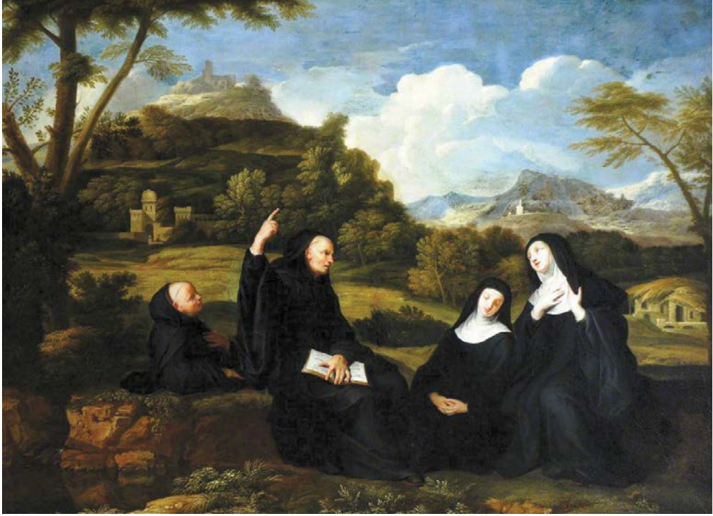
▲ Thánh Benedict (480-547) thành lập 12 cộng đoàn tu sĩ tại Subiaco, nước Ý (nay là vùng Lazio, cách Rome 40 dặm), trước khi đi về phía đông nam để đến Monte Cassino, vùng núi trung tâm của nước Ý. Bức tranh "Saint Benedict and Two Companions in a Landscape" (Thánh Benedict và Thánh Scholastica cùng Hai Đồng Môn trong một Cảnh Quan), từ 1651 đến 1681, của họa sĩ Jean Baptiste de Champaigne. Sơn dầu trên vải canvas. Tổ chức Bảo tồn Di tích Lịch sử, Calke Abbey, Anh Quốc