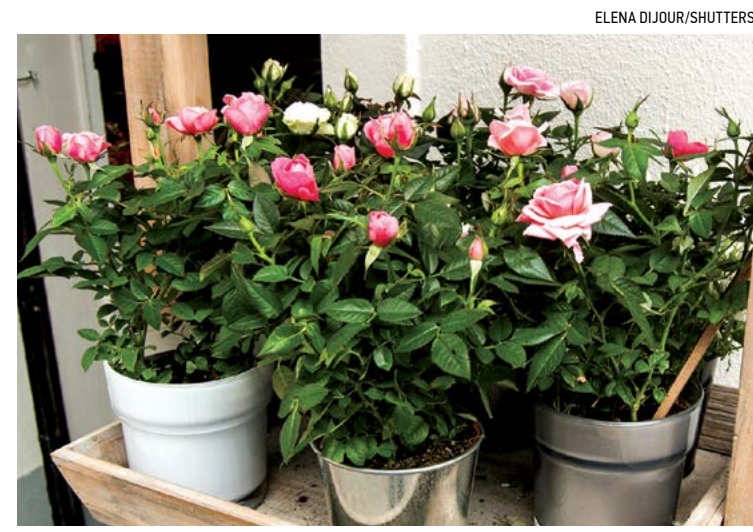
Các chuyên gia khuyến bạn nên mua những cây trong chậu và không mua những cây rễ trần.

Cung cấp dinh dưỡng cho đất Nên bón loại phân hữu cơ đa dưỡng chất ít nhất mỗi năm hai lần, vào mùa xuân và mùa thu. Mặc dù vậy, những người trồng cây ở các khu vực có mùa đông khắc nghiệt nên hạn chế bón nitơgen vào mùa thu để tránh cây lớn nhanh nhưng là yếu ớt, [dễ bị chết] khi thời tiết giá lạnh đến gần. Những