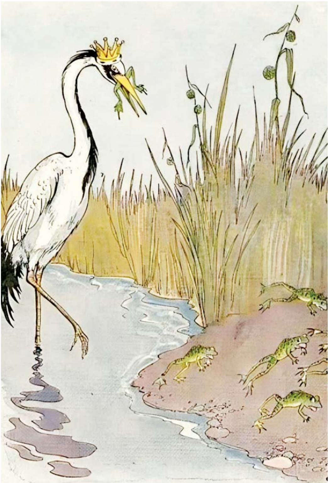
▲ Tranh minh họa "The Frogs Who Wished for a King" (Êch Đòi Có Vua) của họa sĩ Milo Winter, từ tác phẩm "The Aesop for Children" (Truyện Ngụ Ngôn Aesop Dành Cho Trẻ Em), năm 1919.