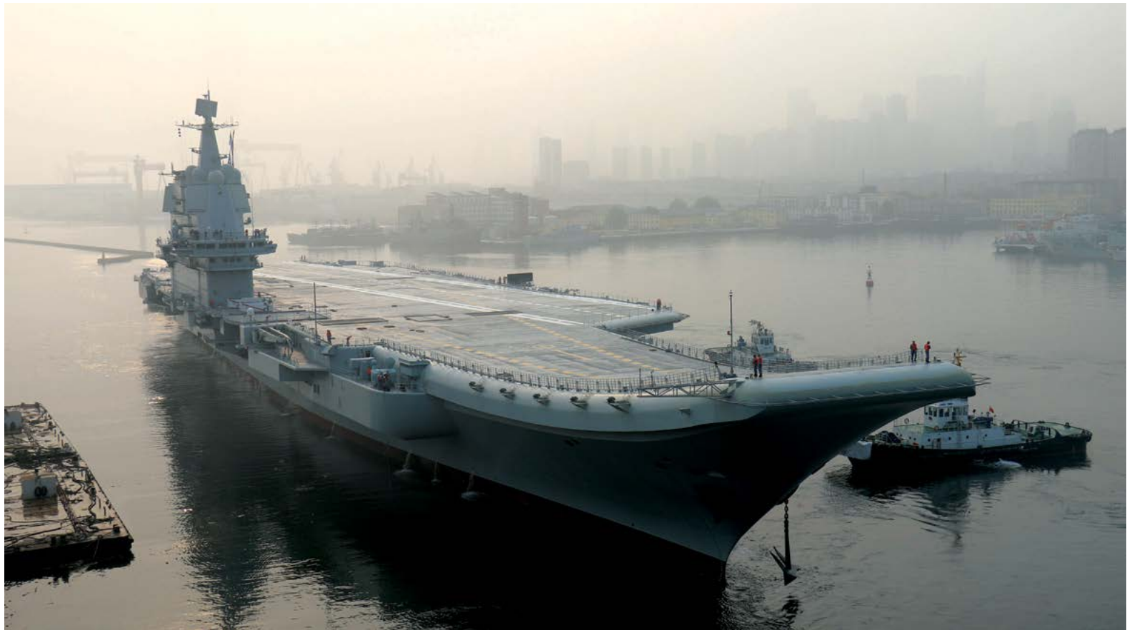
◀ Hàng không mẫu hạm đầu tiên của Trung Quốc được sản xuất trong nước, có tên là "Type 001A" hay "Sơn Đông", đang trên đường quay trở lại cảng Đại Liên, tỉnh Liêu Ninh phía đông bắc Trung Quốc sau chuyến thử nghiệm trên biển đầu tiên vào ngày 18/05/2018.

Tại một hội nghị của các sĩ quan quân đội tại một trong những căn cứ cách mạng nổi tiếng nhất của Trung Quốc hồi tháng Sáu, ông Tập được cho là đã đưa ra những tuyên bố nghe có vẻ khủng khiếp. "Chúng ta đến Điện An để tổ chức một cuộc họp quân sự, chuẩn bị cho một cuộc nội chiến," ông nói trong một phiên