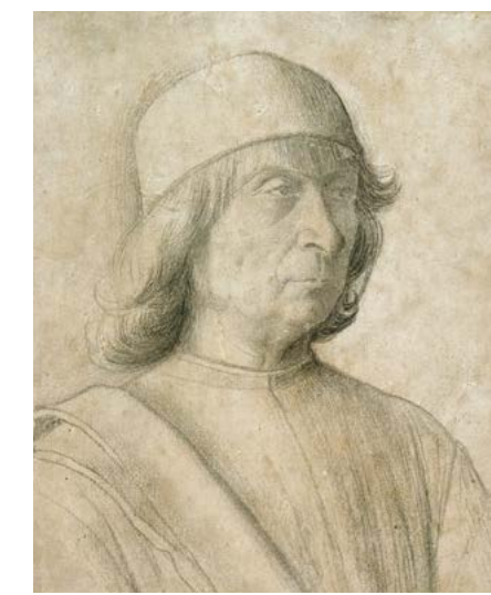
▲ Gentile Bellini, Chân dung tự họa, 1496.

Thông qua nhiều tuyến đường bang giao, đồ gốm sứ xanh trắng của Trung Hoa đã được đưa đến nước Ý, thu hút sự chú ý của các nghệ sĩ tinh tường và những nhà sưu tầm theo phong cách chiết trung [là sự pha trộn của nhiều phong cách, cả phương Đông lẫn phương Tây, cả mới và cũ...] Anh trai của họa sĩ Gentile - là danh họa Giovanni Bellini, vốn là người nổi tiếng hơn - đã sao chép ba món đồ lớn vào bức tranh "Feast of the Gods" (Yếm tiệc của các vị Thần) mà ông vẽ năm 1514 cho văn phòng chước theo phong cách Trung Đông đến Venice - trung tâm buôn bán lớn ở miền Bắc nước Ý. Hơn nữa, các tác phẩm nghệ thuật có giá trị cũng được trao tặng như món quà bang giao giữa