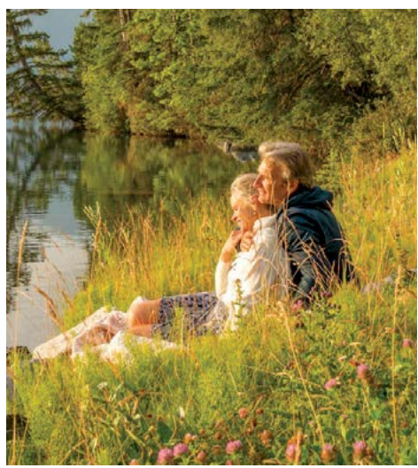
▲ Đi tìm tình yêu tuổi xế chiều là một cuộc phiêu lưu thú vị.