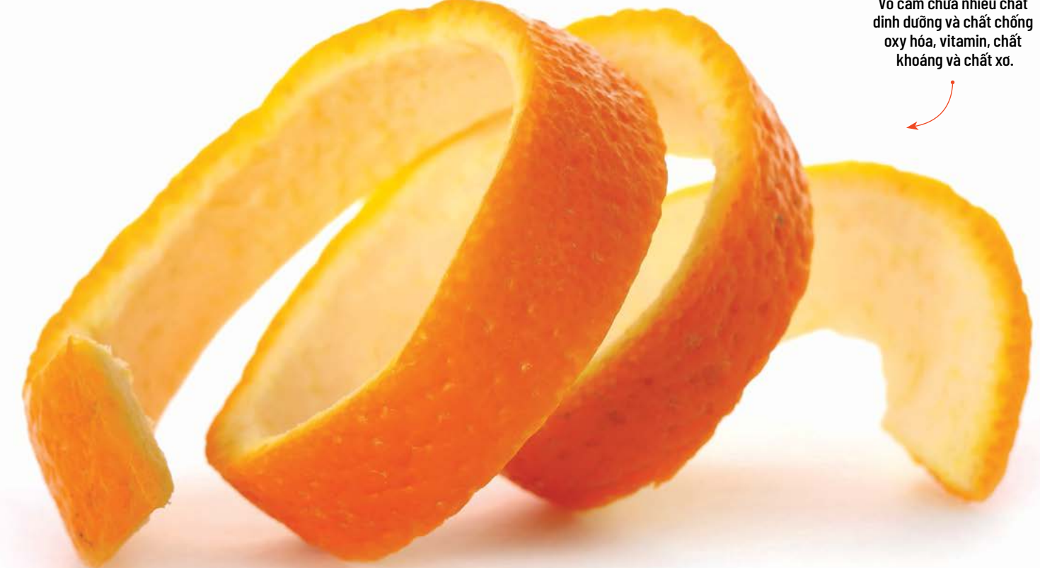
▶ Vỏ cam chứa nhiều chất dinh dưỡng và chất chống oxy hóa, vitamin, chất khoáng và chất xơ.

cách sử dụng hai loại chiết xuất của vỏ cam: thành phần phân cực và không phân cực. (Thành phần phân cực là thành phần hòa tan trong nước hoặc giảm, trong khi phần không phân cực hòa tan trong dầu và kỵ nước.)