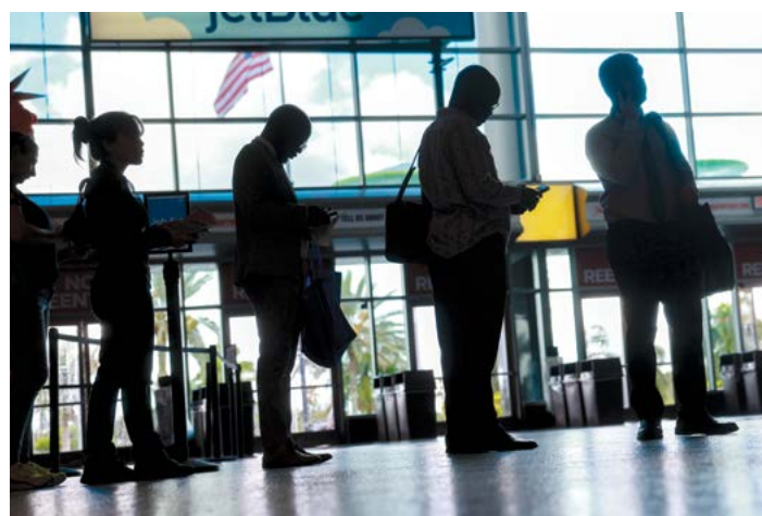
▲ Người tìm việc tham dự hội chợ việc làm ở Sunrise, Florida, hôm 26/06/2024.

Được rào quanh bằng dây xích và hàng rào kẽm gai – một vài chỗ có những mảnh lưới rách nát chắn ngăn cách – những khu trại ở phía đông bắc Weed, California, gần Montague, là một khu hỗn Xem tiếp trang 8