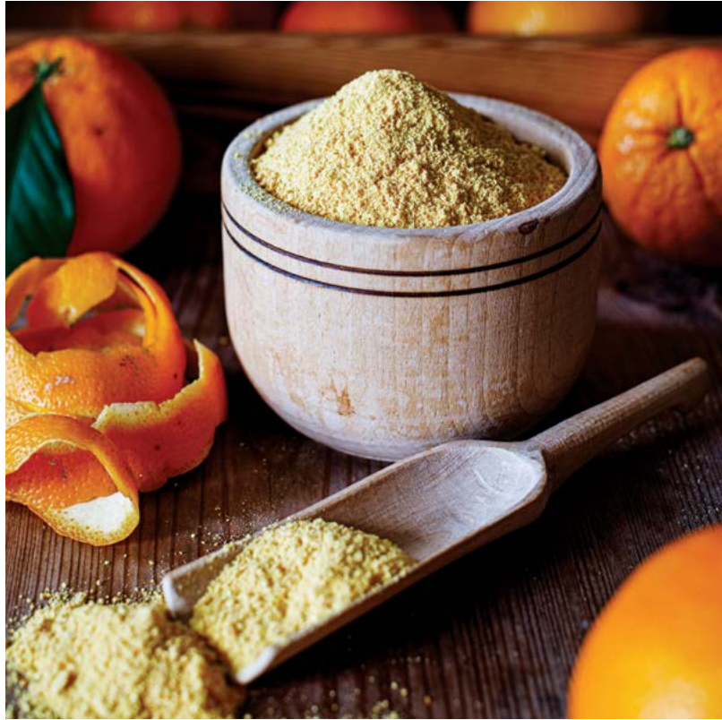
▶ Bạn có thể phơi khô vỏ cam dưới ánh nắng mặt trời hoặc trong lò nướng và nghiền thành bột để thêm vào món sữa lắc hoặc sinh tố.

Các nhà nghiên cứu đã thử nghiệm việc sản xuất TMAO và TMA bằng