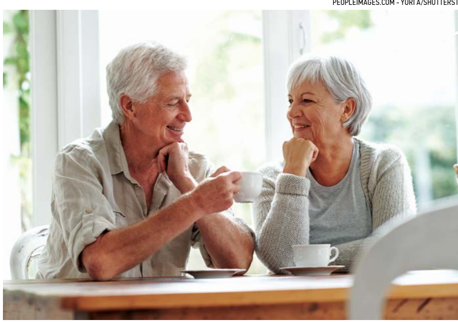
Người lớn tuổi thường có xu hướng khó thích nghi hơn người trẻ tuổi, vì vậy việc trao đổi cởi mở về lối sống và thói quen đã hình thành là điều rất quan trọng.

đã dành cả đời để làm những công việc giúp cuộc sống của bà dễ dàng hơn. “Đúng vậy, ông ấy làm việc chăm chỉ lắm,” người vợ nói. “Nhưng chúng tôi chẳng bao giờ trò chuyện! Ông ấy luôn ra vườn cắt cỏ hoặc nấu bữa tối!” Ông Chapman khuyến các cặp vợ chồng ở mọi lứa tuổi rằng, hãy khám phá ngôn ngữ tình yêu của nhau và bày tỏ chúng thường xuyên. Để khi niềm hạnh phúc lúc mới yêu lắng xuống – thường là trong vòng hai năm, ông nói – thì đời lứa đã có thói quen tốt trong việc thể hiện tình yêu. Đối với những cặp vợ chồng cao niên, nắm ngôn ngữ này có thể giúp họ vượt qua những giai đoạn thăng trầm của cuộc sống tuổi xế chiều. Ví dụ, trong trường hợp người bạn đời mắc chứng bệnh mất trí nhớ, ông Chapman cho biết ngôn ngữ tình yêu chính của họ có thể sẽ thay đổi vì các vùng khác nhau của não bị ảnh hưởng. “Tuy nhiên,” ông chia sẻ rằng, “nắm ngôn ngữ tình yêu này sẽ mang lại cho chúng ta năm cách khác nhau để tiếp cận người ấy và thể hiện tình yêu. Vì phần cảm xúc của bộ não vẫn hoạt động.”