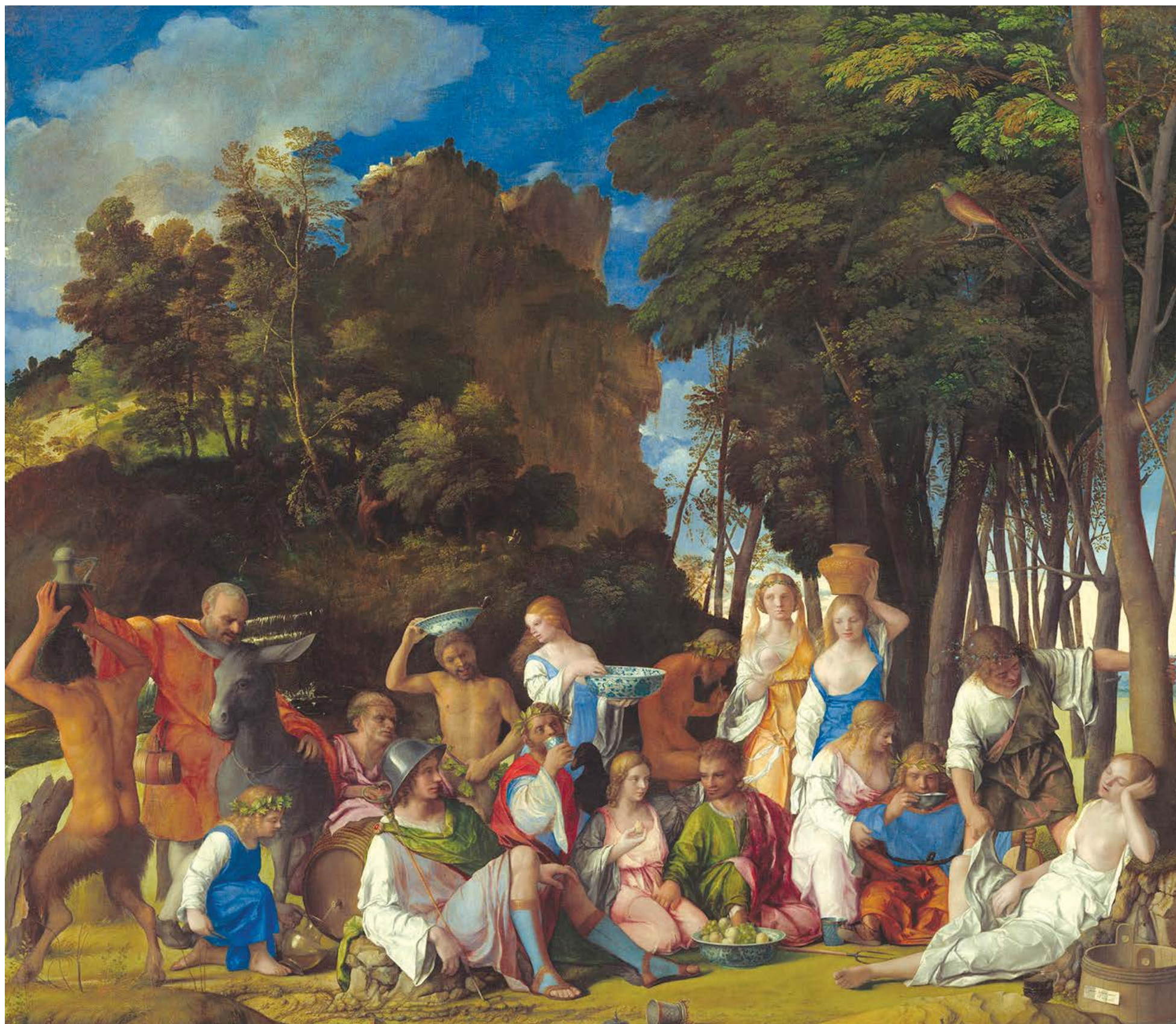
▲ Bức tranh "The Feast of the Gods" (Yếm tiệc của các vị Thần) của hai danh họa Giovanni Bellini và Titian, vẽ năm 1514 và 1529. Tranh sơn dầu trên vải canvas. Phòng trưng bày Nghệ thuật Quốc gia, thủ đô Hoa Thịnh Đốn.