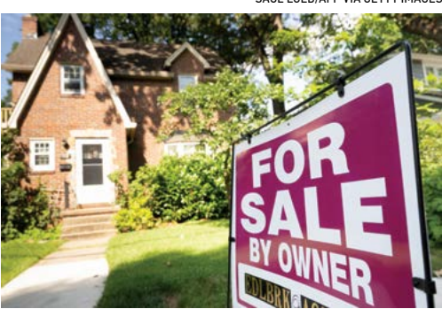
▲ Một ngôi nhà được rao bán tại Arlington, Virginia, vào ngày 13/07/2023.

Ví dụ, trong năm 2023 và cho đến tháng Ba năm 2024 và sau khi điều chỉnh theo lạm phát, chi tiêu của người tiêu dùng Hoa Kỳ đã tăng một hoặc hai điểm. Nhưng sau tháng Ba, chi tiêu của người tiêu dùng đã giảm. Diễn biến đó có thể là