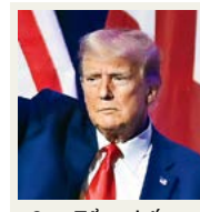
Cựu Tổng thống Donald Trump.

lực lật ngược kết quả bầu cử năm 2020 của ông có thể vi phạm các quy tắc dân chủ nhưng điều đó không có nghĩa là vụ kiện sẽ được giải quyết nhanh chóng. Bình luận của họ được đưa ra sau khi cựu TT Trump và 18