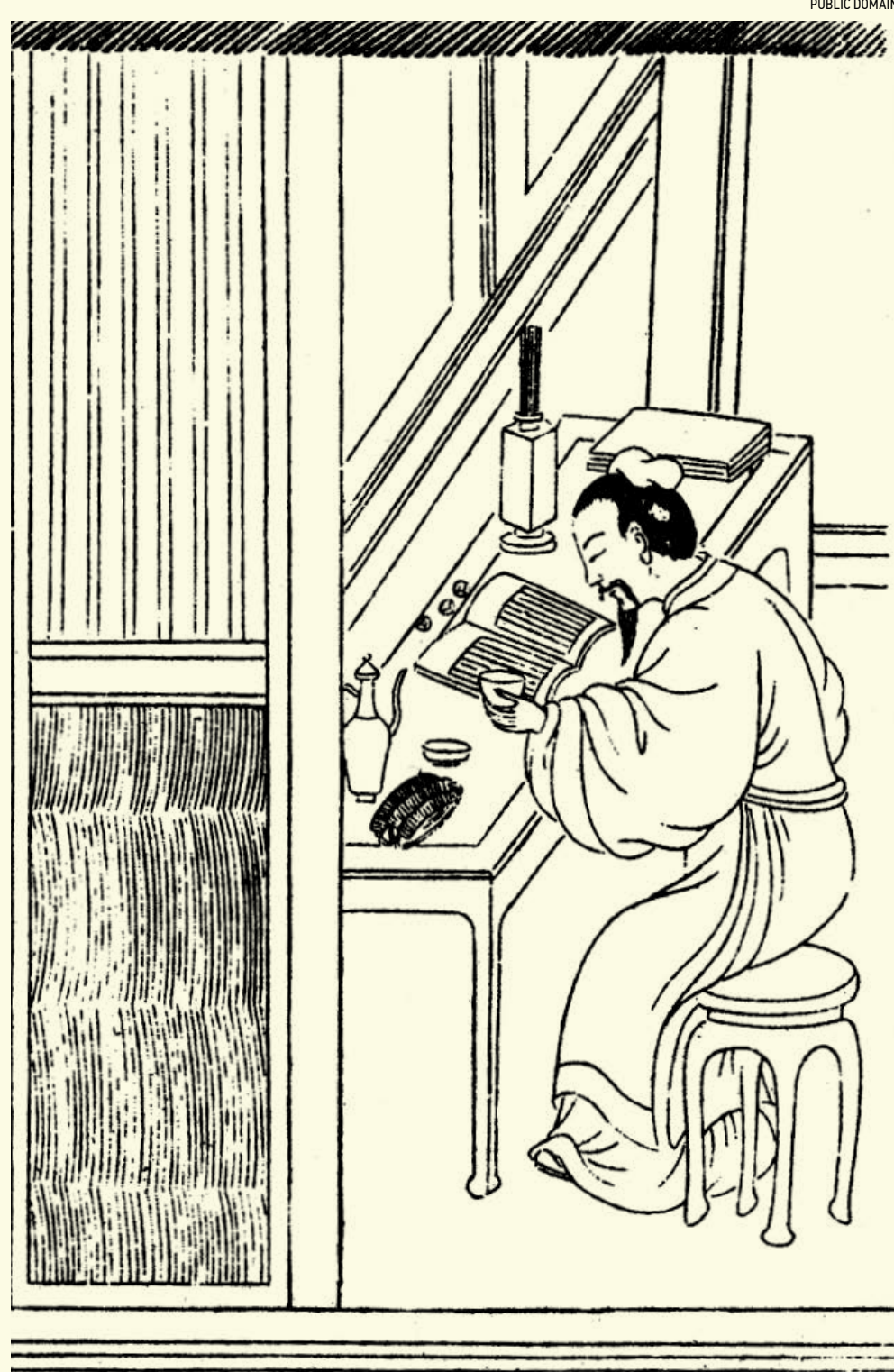
▲ Được – mắt trong mệnh đã được định sẵn, phú quý thuộc về người nào, quả thực là do Trời quyết định, sức người không thể thay đổi. (Ảnh minh họa)

Ngày hôm sau, tú tài Ất vội vàng đi vào trường thi, không hề hay biết chuyện gì đã xảy ra. Đến khi cậu viết bộ bài phú các vị Thần Tiên làm, vội vàng chép lại, một chữ cũng không sót. Hai người quý xuống trước tượng