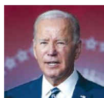
TT Joe Biden tại một sự kiện ở Salt Lake, Utah, hôm 10/08/2023.

Hôm 10/08, Tổng thống (TT) Hoa Kỳ Joe Biden đã gọi nền kinh tế Trung Quốc là “quả bom hẹn giờ” – một nhận xét đã thu hút sự phản đối từ chính quyền Trung Quốc khi chính phủ của ông nói lại mối bang giao với Bắc Kinh.