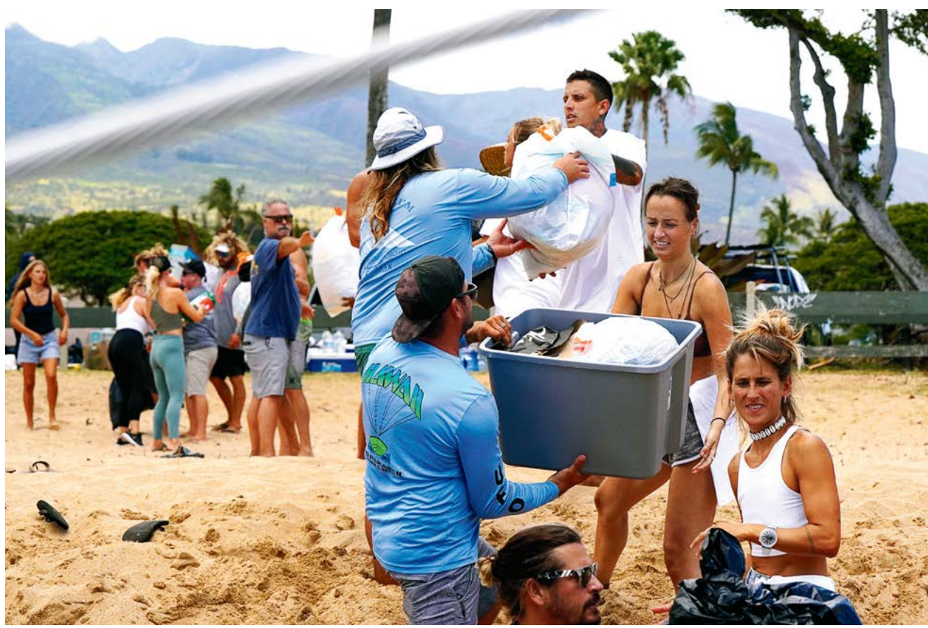
▲ Các tình nguyện viên giúp đỡ hàng tiếp tế cho các khu vực bị thiên tai, trên Bãi biển Kaanapali của Tây Maui ở Hawaii hôm 12/08/2023.

Khi nói đến nhà ở, chi phí sinh hoạt, thuế, bảo hiểm, và kể cả chi phí cho thực phẩm, thì South Dakota là tiểu bang thắng thế về nơi sinh sống có giá cả phải chăng nhất ở Mỹ quốc. Trong báo cáo “Cheapest States to Live in 2023” (Các Tiểu Bang Rẻ Nhất Để Sống Vào Năm 2023), Scholaroo – một nền tảng tìm kiếm học bổng đại học – đã phân tích toàn bộ 50 tiểu bang bằng cách sử dụng 31 số liệu, gồm có chi phí cấp, internet, tiện ích, y tế, giao thông, và thậm chí cả chi phí cắt tóc và làm móng. Indiana đứng thứ hai, tiếp theo là Arkansas, Mississippi, và Nebraska. Xem tiếp trang 9