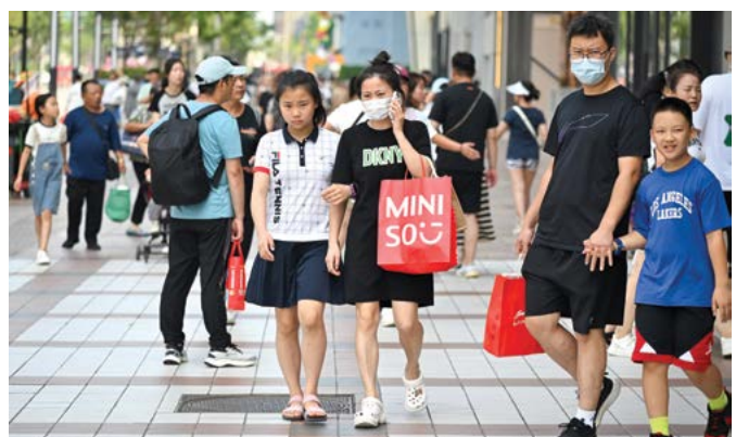
► Mọi người ghé thăm một khu phố kinh doanh ở Bắc Kinh, hôm 15/08/2023.

POSTMASTER: PLEASE DELIVER PROMPTLY TIME-SENSITIVE NEWS PERIODICALS